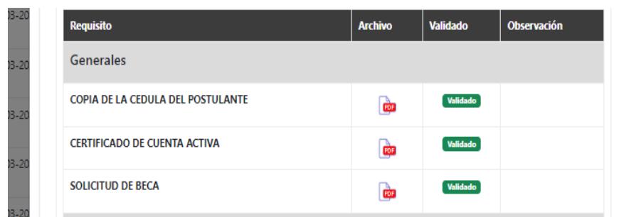
Figura 3: Revisión de requisitos presentados por los postulantes