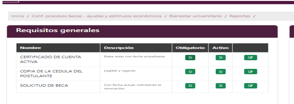
Figura 2: Requisitos para renovación de Beca